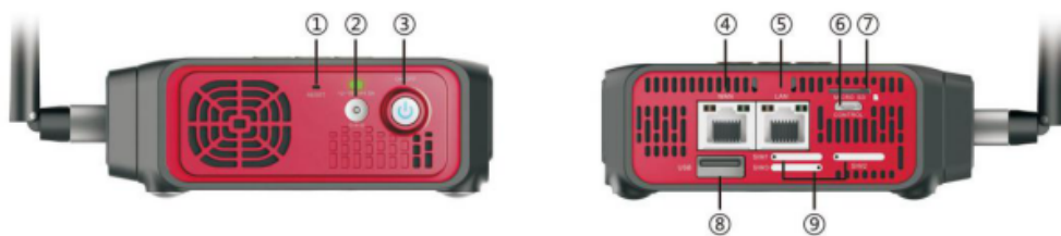
接口说明: ①重置键 ②电源接口 ③开/关机按键 ④WAN口 ⑤LAN口 ⑥控制接口 ⑦SD卡槽 ⑧USB接口 ⑨Nano SIM卡槽